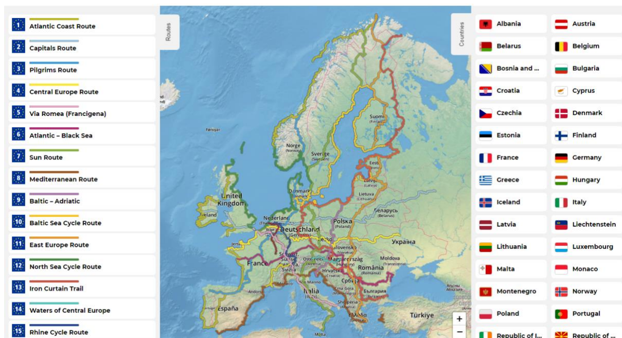
ЕуроВело руте.

У Нацрту новог Просторног плана Републике Србије од 2021. до 2035. године (чије се усвајање ускоро очекује) налазе се све бицикличке Еуровело руте које пролазе кроз Србију. На странама 284-285 дат је детаљан преглед ових рута. Просторни развој бицикличког саобраћаја и мреже бицикличких стаза засниваће се на активностима на коридорима бицикличких стаза (који садрже главну и алтернативне руте) на територији Републике Србије и то промотивне и привредне активности. Планиран је основним правцем север-југ са бочним везама и системом центара развоја циклотуризма у циљу остваривања међудржавне сарадње (у склопу европске мреже бицикличких рута – Еуровело , и то: